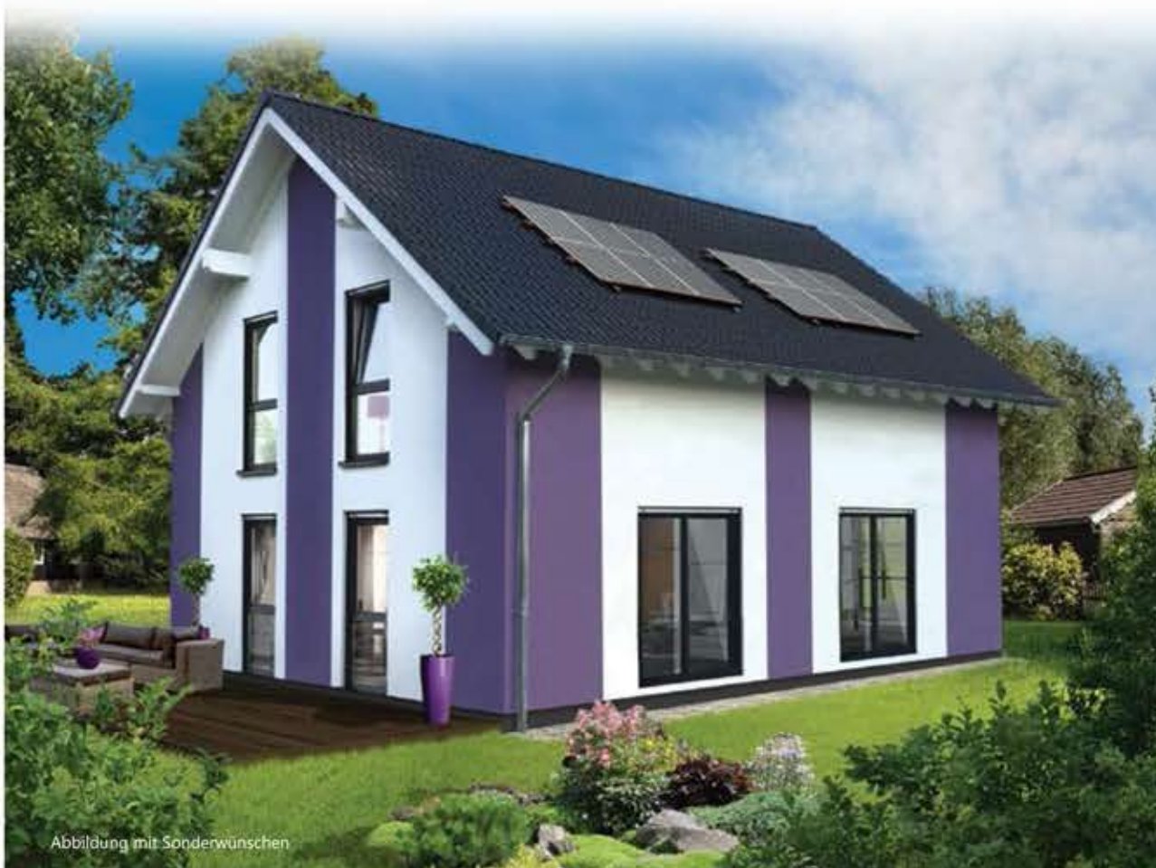
Abbildung mit Sonderwünschen