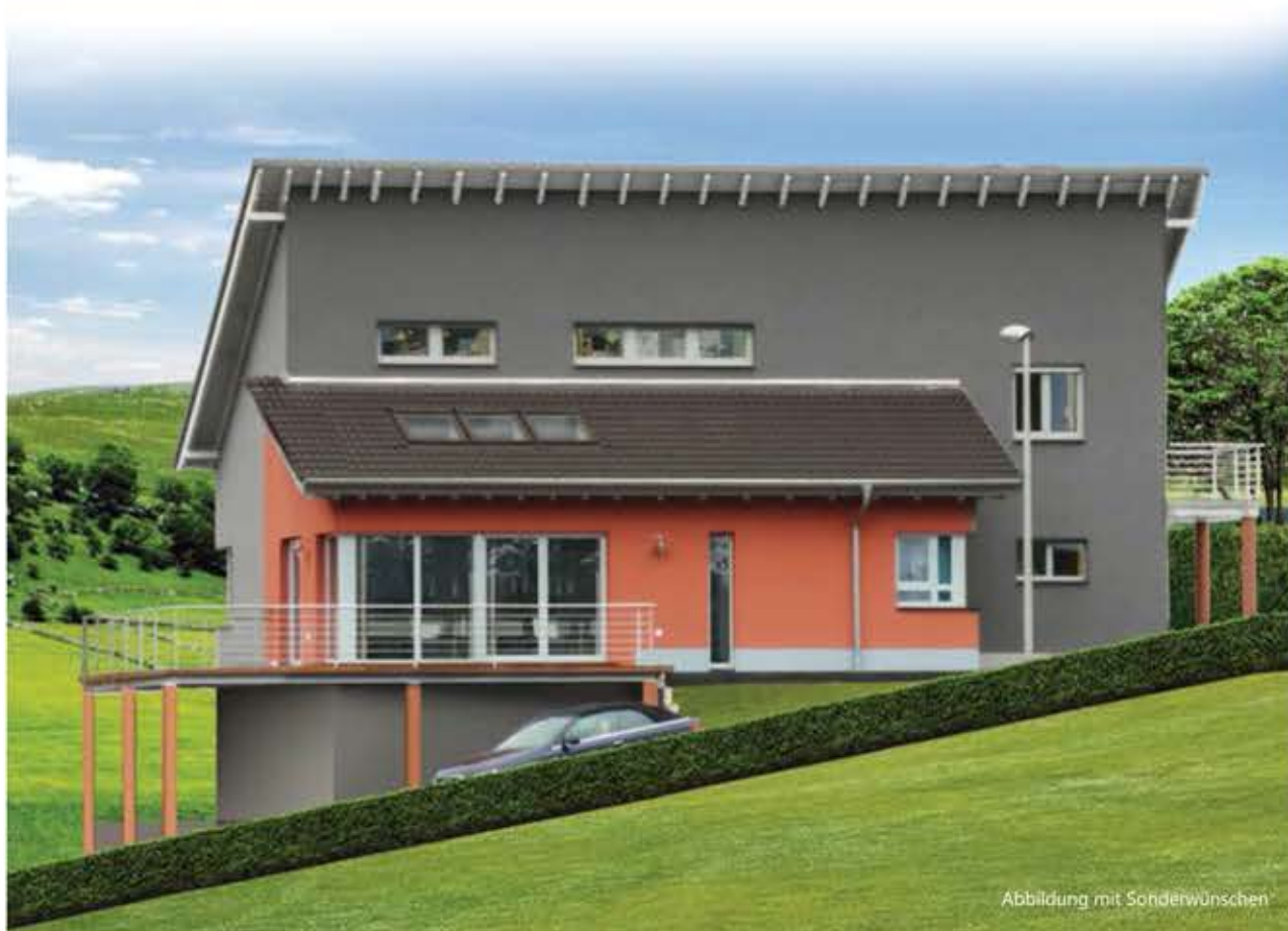
Abbildung mit Sonderwünschen