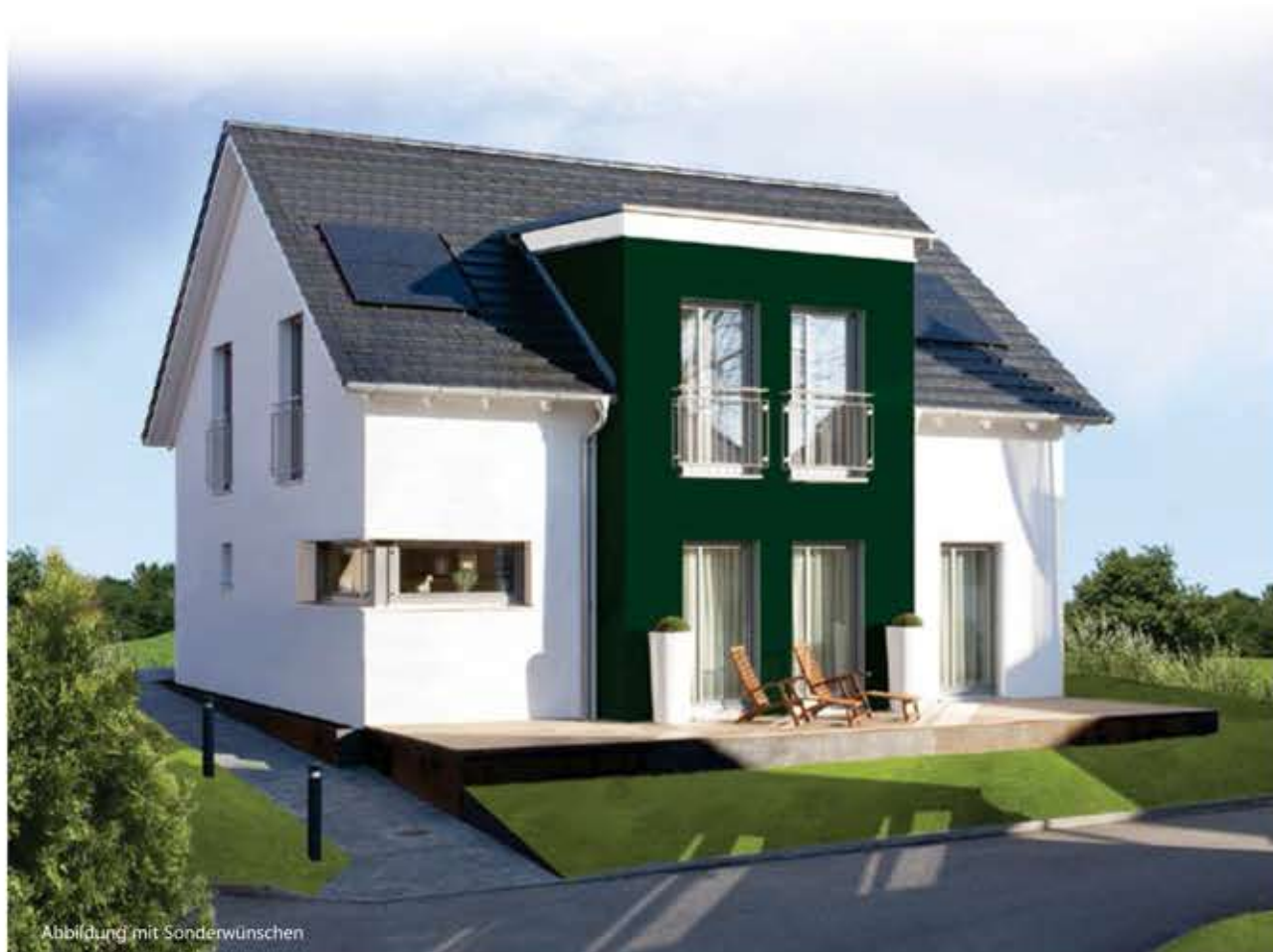
Abbildung mit Sonderwünschen