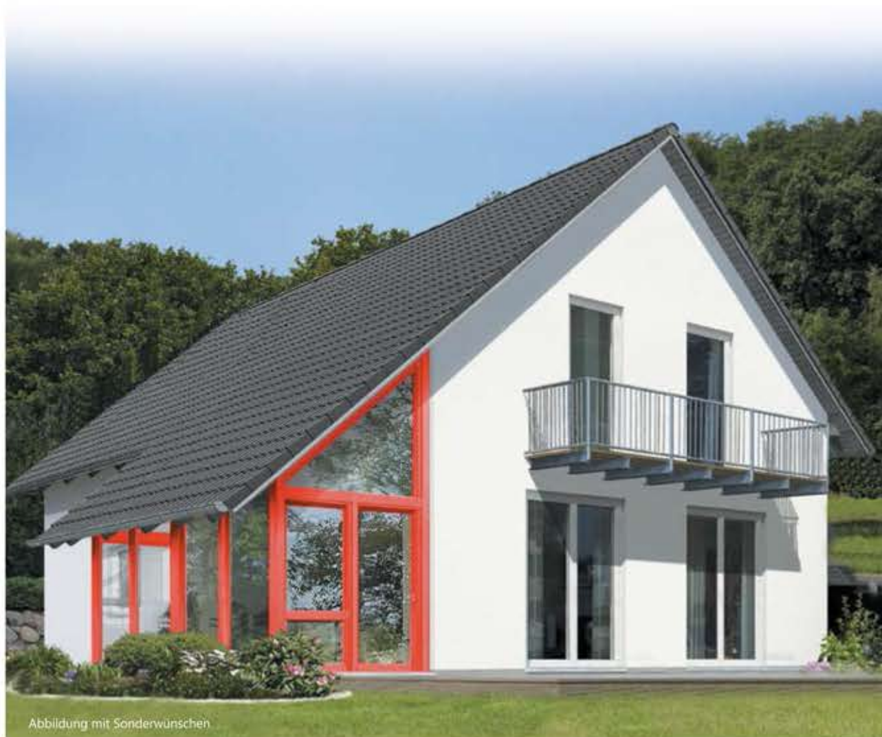
Abbildung mit Sonderwünschen