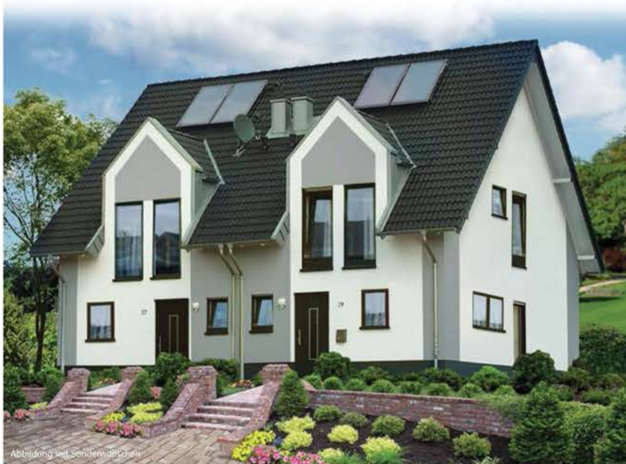
Abbildung mit Sonderanfertigung