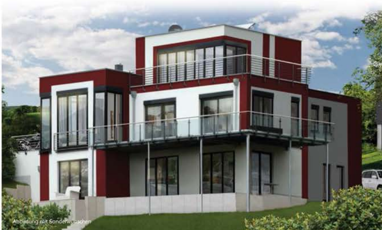
Abbildung mit Sonderwünschen