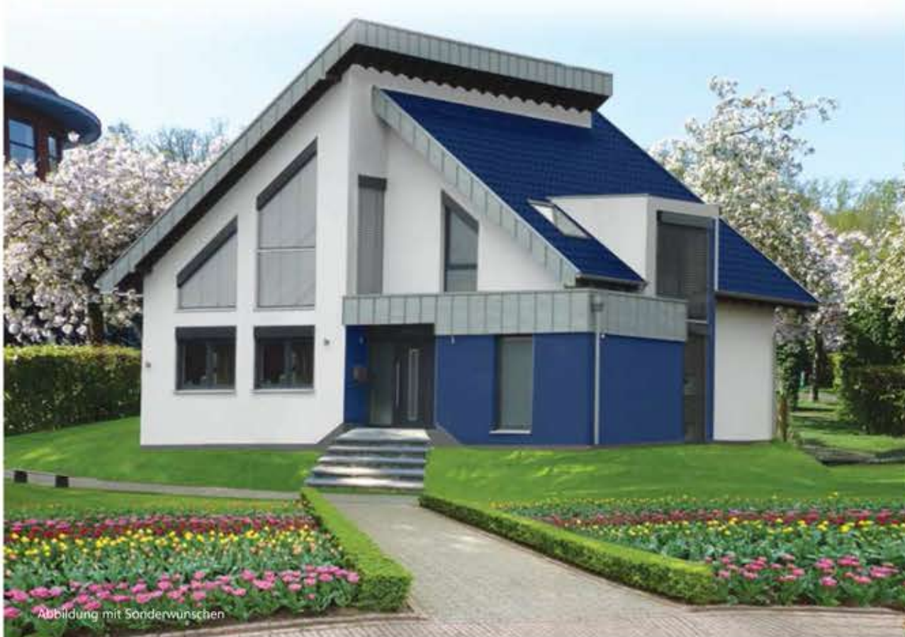
Abbildung mit Sonderwünschen