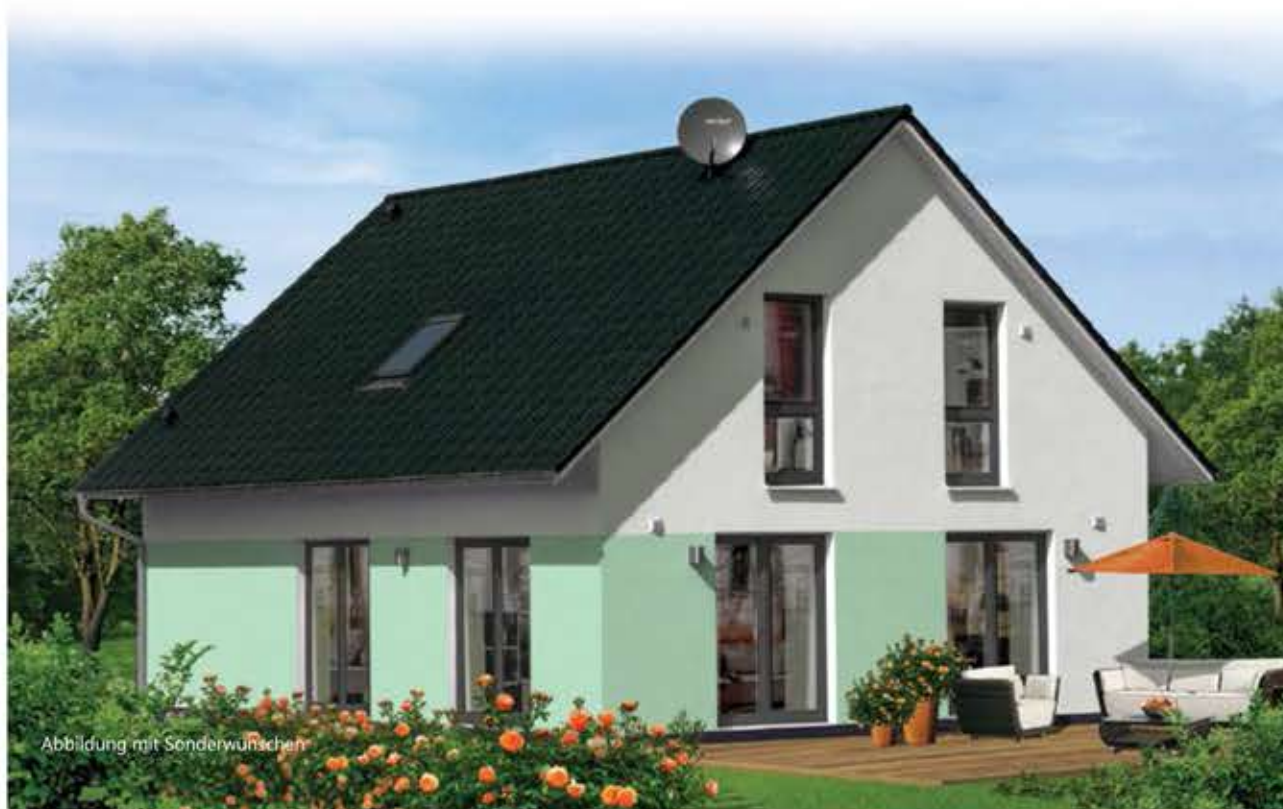
Abbildung mit Sonderwünschen