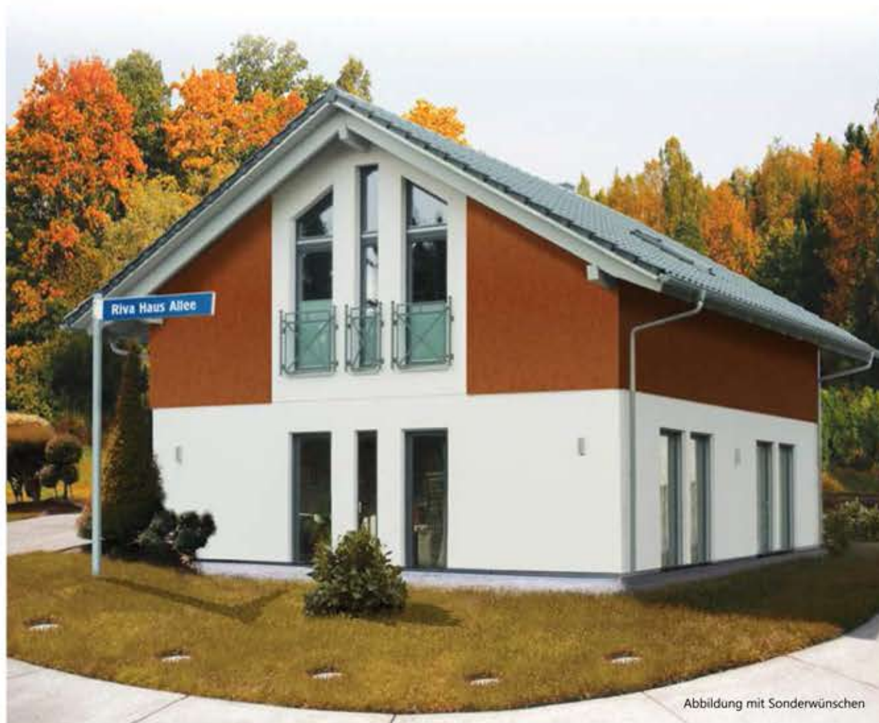
Abbildung mit Sonderwünschen