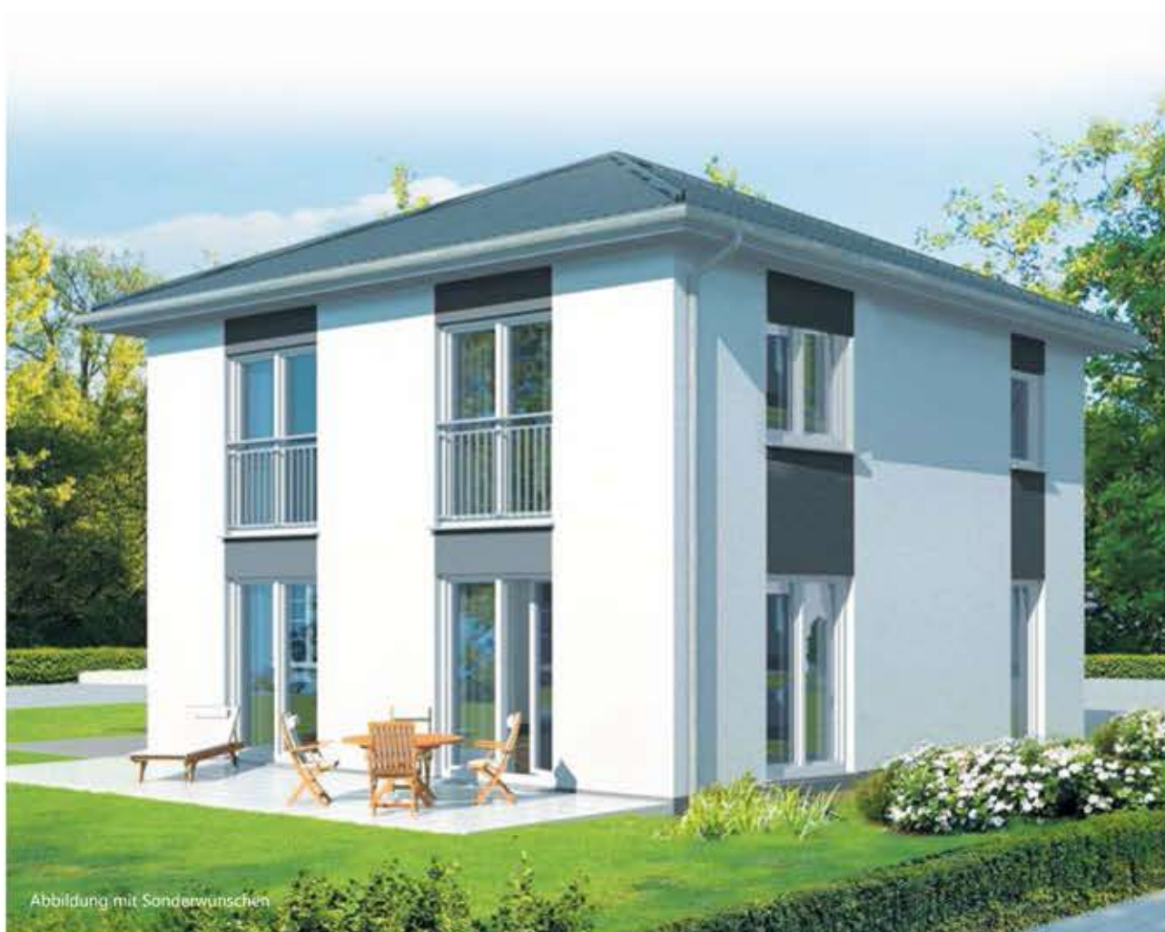
Abbildung mit Sonderwünschen